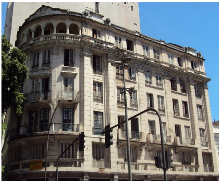
FACHADA DO EDIFÍCIO PARIS (PRAÇA TIRADENTES, 32)

Também em janeiro houve mais um pedido de licença de transformação de uso na área do Reviver Centro com os favores da LC 264/23, que modificou a LC 229/2021. Trata-se do retrofit do edifício que se destinaria ao Hotel Le Paris, na Praça Tiradentes n° 32 com numeração suplementar pela Avenida Passos n° 7, na área do Corredor Cultural. Para esse endereço havia uma licença de modificação com acréscimo de área em edificação destinada a hotel, que nunca chegou a ser inaugurado. Agora deverá ser transformada em prédio de uso misto com 1 loja e 18 apartamentos, totalizando 1.387 m 2 (acrécimo de 58 m 2 ).