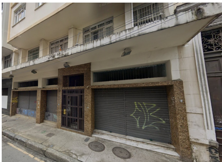
RUA DO REZENDE, 39

Em abril deu entrada um pedido de licença de transformação para uso misto na área do Reviver Centro, na Rua do Rezende n° 39, com a criação de 8 novas unidades residenciais e 2 comerciais, em uma área de 615 m 2 . Trata-se de edificação com 11 pavimentos no total, dos quais apenas 3 (térreo, sobreloja e 3° piso são objeto de modificação com os favores da LC 229/2021.