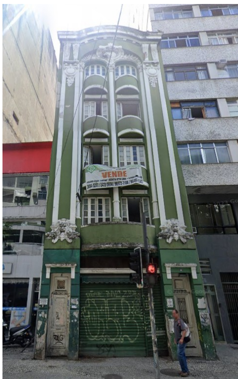
RUA RIACHUELO, 44

Houve uma licença com benefícios da LC 229/2021 no mês de fevereiro de 2024 na área do Reviver Centro, com a transformação de uso de edifício comercial para misto na Rua Riachuelo nº 44, com 16 unidades residenciais.