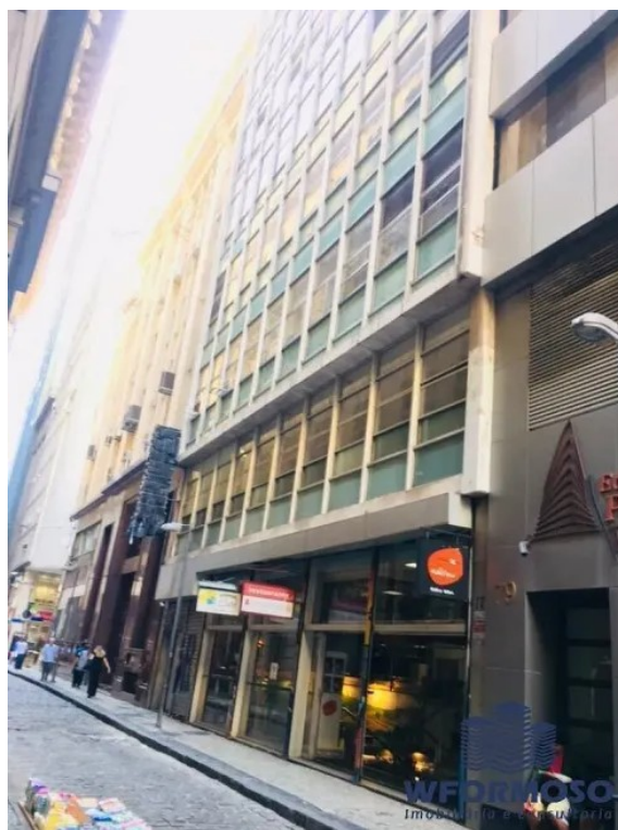
RUA DO OUVIDOR, 77

Em março deu entrada um pedido de licença de transformação para uso misto na área do Reviver Centro, na Rua do Ouvidor n° 77, com a criação de 60 novas unidades residenciais e 12 comerciais, em uma área de 4.092 m 2 .