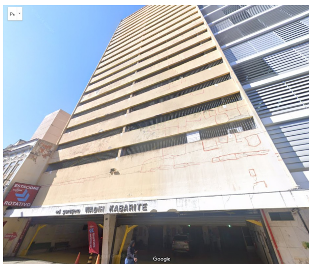
RUA BUENOS AIRES, 339

Não houve licenças com benefícios da LC 229/2021 no mês de agosto de 2024 na área do Reviver Centro. Houve apenas um pedido de licença de transformação de uso de edifício-garagem para uso misto na Rua Buenos Aires 339, no Centro, com 168 unidades habitacionais e 1 loja, em uma área total de 11.680 m 2 .