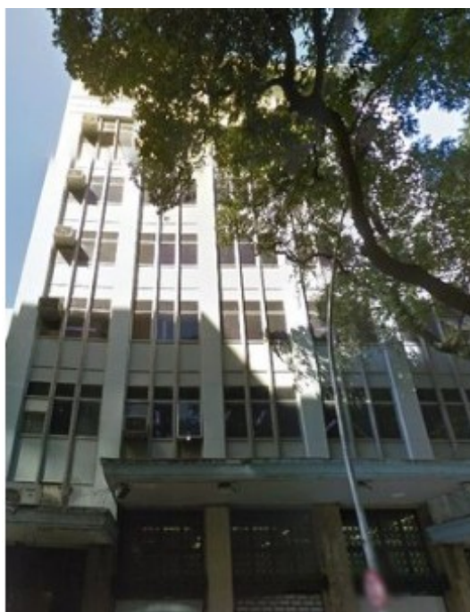
RUA VISCONDE DE INHAÚMA 65

Não houve licenças com benefícios da LC 229/2021 no mês de junho de 2024 na área do Reviver Centro, e nem nas áreas receptoras. Houve um novo pedido de licença de transformação de uso para a Rua Visconde de Inhaúma 65, no Centro, com a criação de 35 novas unidades habitacionais.