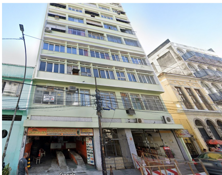
RUA MONCORVO FILHO, 66

Houve apenas uma licença concedida com os benefícios da LC 229/2021 no mês de outubro de 2024 na área do Reviver Centro: legalização de transformação de uso de duas unidades Rua Rua Moncorvo Filho 66, Centro, com a criação de 2 unidades habitacionais perfazendo de 117 m 2 .