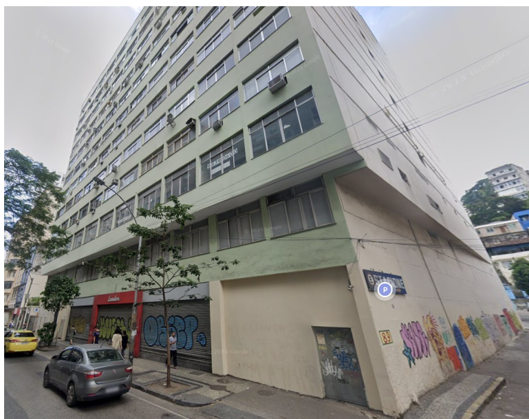
RUA RIACHUELO, 87

Houve uma licença concedida com os benefícios da LC 229/2021 no mês de setembro de 2024 na área do Reviver Centro: transformação de uso da sobreloja do edifício Rei da Voz, na Rua Riachuelo 87, Lapa, que passa a ser misto com a criação de 28 unidades habitacionais em um piso de 396 m 2 .